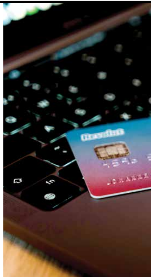
Spojení platební karty a počítače. Vždy mějte na paměti, že přináší i rizika