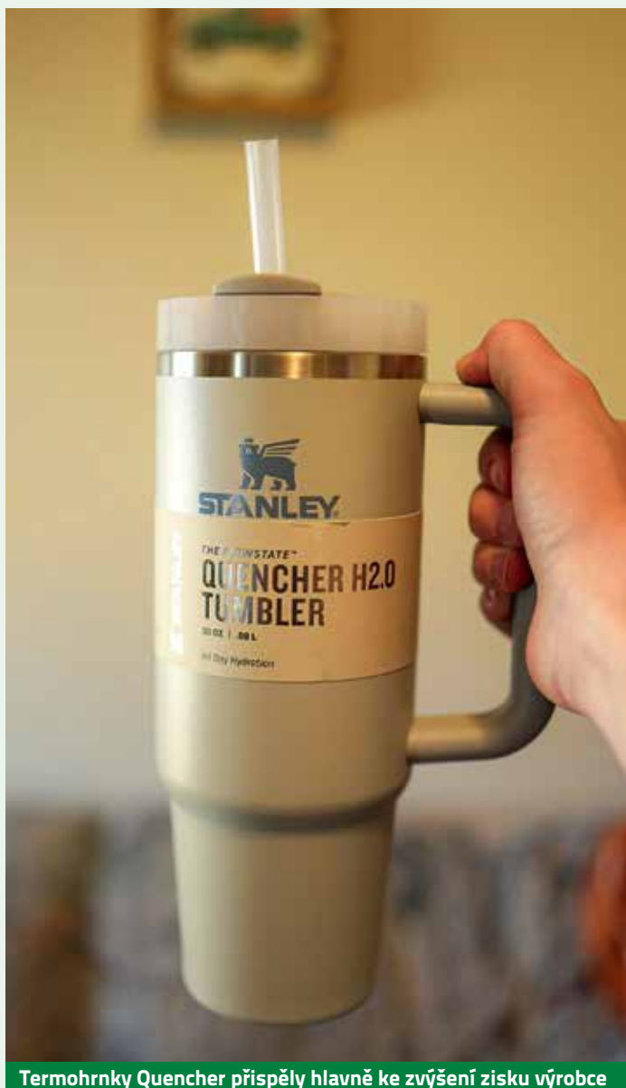
Termohrnky Quencher přispěly hlavně ke zvýšení zisku výrobce

ČASOPIS THE NEW YORK TIMES NAPSAL, ŽE HRNEK ZNAČKY STANLEY, HIT LOŇSKÉHO ROKU, ZNAMENÁ JASNÉ VÍTĚZSTVÍ PRO PLANETU. JE ODOLNÝ, OPAKOVANĚ POUŽITELNÝ A NA ROZDÍL OD PLASTOVÉ LÁHVE NEGENERUJE HROMADY PLASTŮ. ANO, V PODSTATĚ JE TO PRAVDA. JAKÁ JE ALE REALITA?