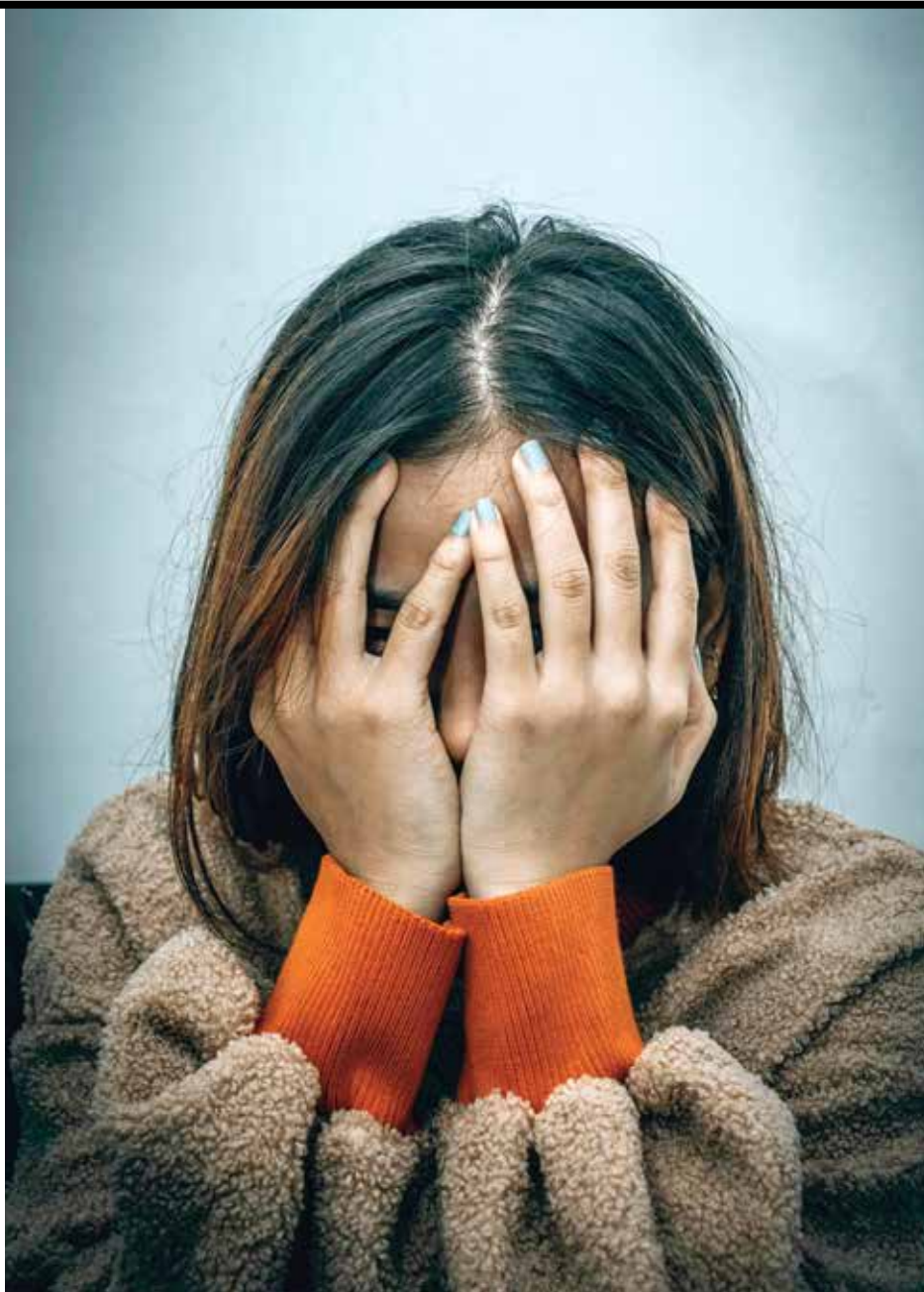
Neřešené chyby z minulosti nakonec dostihnou každého. Především jde o dluhy

kde máme pro podobné účely uloženou výbavu darovanou našimi obyvateli. Velkou radost jsme měli zejména z opravdu krásného nábytku do dětského pokoje, který se nám společnými silami také podařilo pro chlapce zajistit. Moji kolegové jsou navíc tak hodní, že mi tu a tam pomohou něco smontovat, nebo něco přivést či odvézt dodávkou.