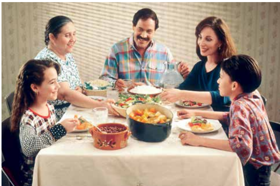
Společné stolování je ideálním prostorem pro sdílení rodinného života

Podpora duševního je jako skládačka. Neexistuje jedna šablona, jak dítěti pomoci, aneb když uděláte krok A dojdete do bodu B. Často je to metoda pokus/omyl a navíc proces s nutností velké dávky trpělivosti a vzájemného respektu.