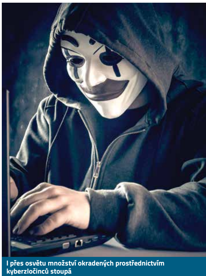
I přes osvětu množství okradených prostřednictvím kyberzločinců stoupá

NA POČÁTKU STÁLO ZAZVONĚNÍ TELEFONU, NA JEHOŽ DRUHÉ STRANĚ SE OZVAL PRACOVNÍK BANKY. NA KONCI TOHOTO PŘÍBĚHU PAK ZŮSTALA ŽENA OKRADENÁ O MILIONY KORUN. ČLOVĚK VYDÁVAJÍCÍ SE ZA BANKÉŘE BYL VE SKUTEČNOSTI PODVODNÍK, JEHOŽ CÍLEM BYLO VYLÁKAT Z VYTIPOVANÉ OBĚTI CO NEJVÍCE PENĚŽ. V TOMTO PŘÍPADĚ SE MU TO NANEŠTĚSTÍ PAVEDLO.