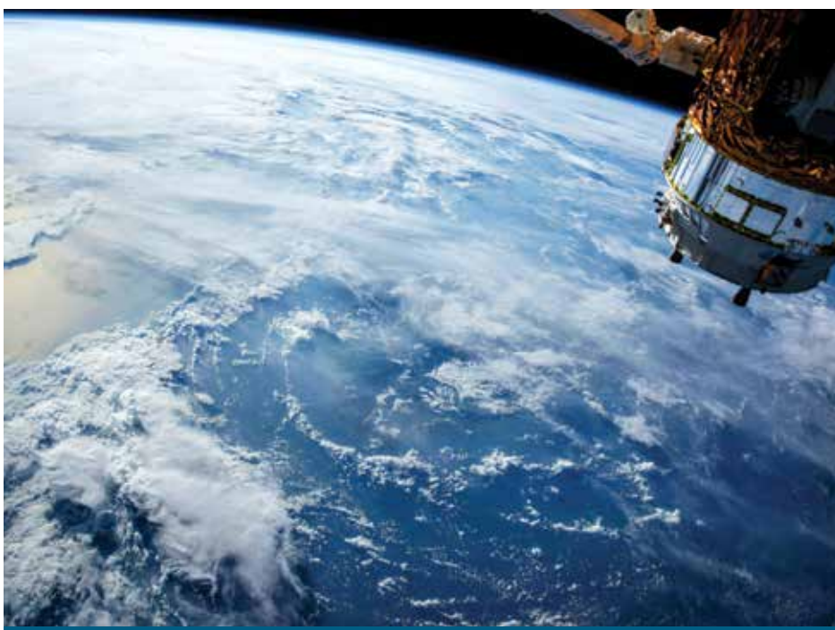
Záchranu planety často doprovázejí pohádky

Nebylo pak překvapením, když se na open party dostavily celebrity ze světa módních influencerů a módních návrhářů. Všichni tihle znalci stáli v dlouhé frontě, jenom aby se dostali dovnitř. Vždyť taky všechno uvnitř navrhoval slavný Bruno Palessi! A když byli uvnitř, nešetřili ani penězi, ani chválou.