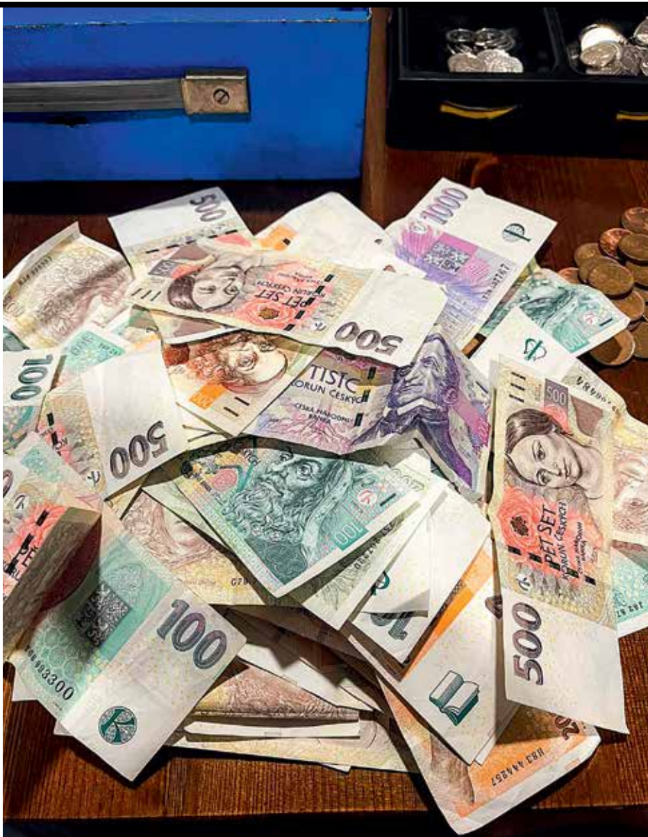
Hromádka veřejných peněz je jedna a tatáž

Vadí mi, že pod hlavičkou vědy bují za veřejné peníze politický aktivismus.