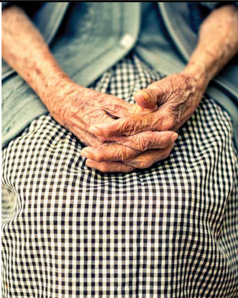
Nejen seniorům se může neuvážený krok při prodeji nemovitosti vymstít

nemovitosti, resp. jeho podílu provázely, i jaké jsou podíly ostatních spoluvlastníků. Na základě zjištěného může v konečném důsledku přivolit k tomu, aby byla nemovitost přikázána do vlastnictví většinového spoluvlastníka.